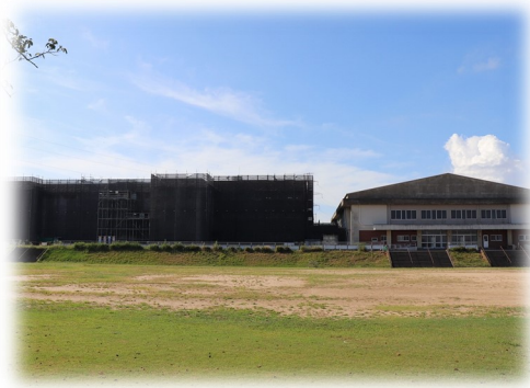
工事中の校舎外観