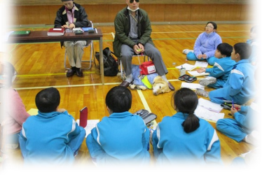
バリアフリー教室