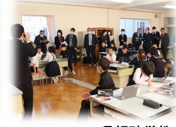
県視聴覚教育研究大会