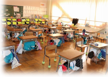
シェイクアウト訓練