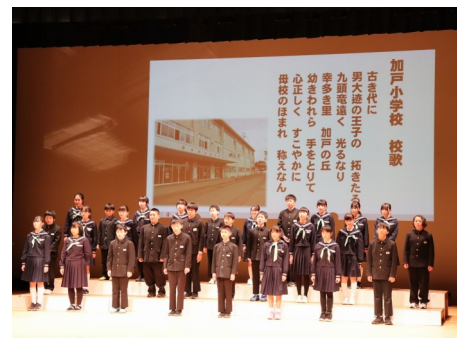
みくに大好き交流会